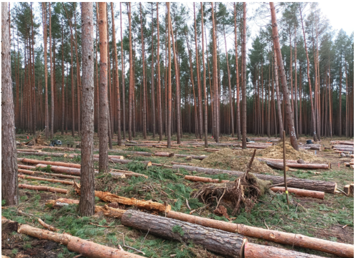
Abbildung 4: Parzelle 4, Syntropischer Waldumbau entlang eines Lichtgradienten (rechts Kahlschlag, links Schirmstellung)

Die während des Einschlags (hochdurchforstungsartige Auslesedurchforstung mit variierender Stärke des Eingriffs) anfallenden Baumstämme werden beidseitig entlang der Saatreihen mit 3m, bzw. 1,5m Abstand (zu jeweils 50 % auf der Fläche verteilt) abgelegt.