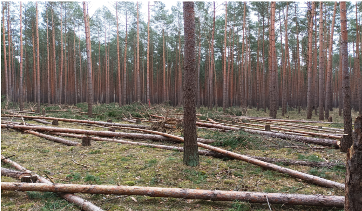
Abbildung 2: Parzelle 2, Lochhiebsituation nach Einschlag im Februar 2022

Im Rahmen der Flächenanlage wurden drei Lochhiebe durchgeführt. Zuvor wurden innerhalb der zukünftigen Lochhiebsfläche im 2 m Reihenabstand ca. 80 cm breite Saat- bzw. Pflanzstreifen mittels Einachsfräse angelegt. Der motormanuell erfolgte Einschlag wurde so geführt, dass drei, innerhalb der Parzelle gleich verteilte Lochhiebe von ca. 500-700m 2 Durchmesser entstanden. Dabei wurde der Altbestand komplett zu Boden gebracht und das anfallende Holz zwischen den potenziellen Pflanzreihen angeordnet. Im restlichen, die drei Lochhiebe umgebenden Bestand, wurde eine schwache Hochdurchforstung durchgeführt, um die verbleibenden Kiefern zu stabilisieren. Das anfallende Holz wurde dabei zu Boden gebracht und ebenfalls im Bestand belassen.