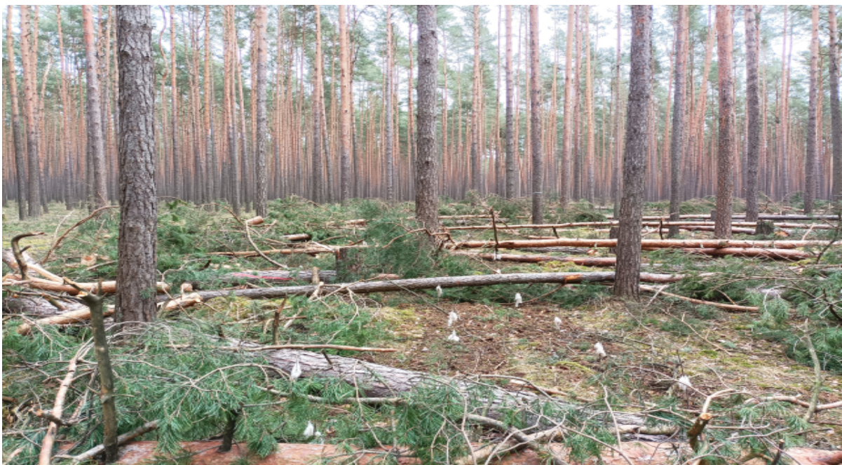
Abbildung 3: Parzelle 3 „Mikado“ / Verhau nach dem Einschlag im Februar 2022

In dieser Parzelle wurden im Herbst 2021 reihenweise (zwischen den bereits existierenden Baumreihen) Saat- und Pflanzgut eingebracht. Der Boden wurde mittels Einachsfräse vorbereitet, die drei verschiedene Saat- und Jungpflanzenmischungen wurden händisch ausgebracht. Dabei wurde jede Mischung noch einmal in zwei Mischungen unterteilt. Die Mischung A beinhaltet Pioniergehölze, die Mischung B